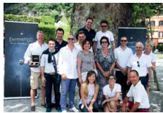
In alto, MAX 2. Sopra, premiazione vincitori gara regolarità con due orologi Eberhard ultimissimo modello.

Automobile del 1922 di 10 metri del cantiere Excelsior del lago di Ginevra, Governilli III del cantiere Chris Craft del 1930, Saint-Louis un Hacker Craft del 1935. L'attacco di 9 metri e cinquanta del 1973 costruito dal cantiere russo Ship Building Plant, Max , un runabout fuoribordo del cantiere Mattner, anno 1955, che ha vinto la gara di regolarità cronometrata. La prova consisteva nel compiere tre giri intorno a