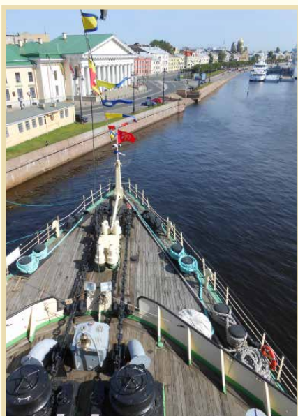
A sinistra: la prua del rompighiaccio Krasin. Sopra: i tubi lanciasiluri del sommergibile della Seconda guerra mondiale. Sotto: strumentazioni e comandi del sommergibile e, a destra, uno scafandro d'emergenza.