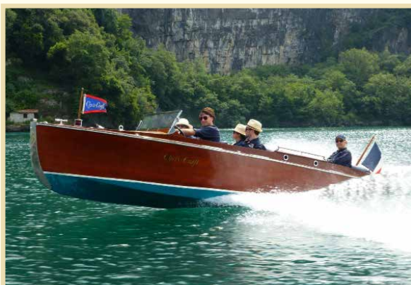
Sopra: Gwennili III del cantiere Chris craft del 1930. Sotto: Max, un runabout fuoribordo del cantiere Mattonat, anno 1955, che ha vinto la gara di regolarità.