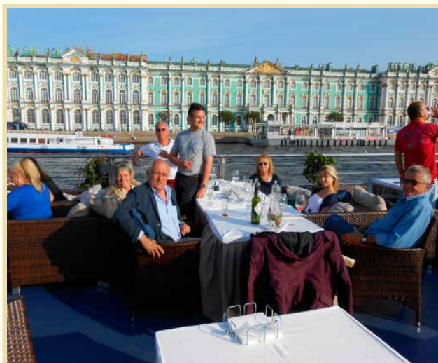
Sopra: un piacevole aperitivo sul battello Volga-Volga con il palazzo dell'Hermitage sullo sfondo.

europei. I soci ASDEC sono rimasti affascinati dal palazzo-museo dell'Hermitage e dalle due residenze estive degli Zar, la Versailles del Baltico e il palazzo di Caterina, con l'incredibile camera d'ambra. Il Museo dell'Artico e dell'Antartico ha permesso a tutti di immergersi nel mondo estremo, ma le impressioni più forti sono state vissute durante la visita dell'interno di un sommergibile della seconda